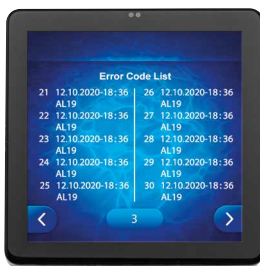
Historique des 50 derniers événements