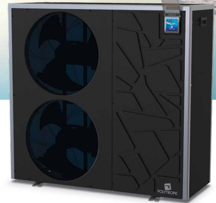
MASTER INVERTER XL Tri

Grâce à son système de régulation intelligente exclusif , la pompe à chaleur réversible Master-Inverter régule sa puissance en fonction de la température de l'eau mais aussi en fonction de la température ambiante afin de toujours assurer la bonne température de baignade, le meilleur COP* et le plus bas niveau sonore !