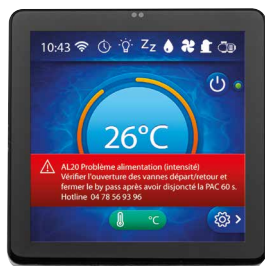
Affichage de l'alarme, diagnostic et solution de résolution