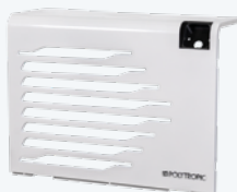
EN OPTION : CRISTAL Métal blanc brillant en option