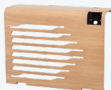
EN OPTION : WOOD Bois FSC issus de forêts gérées de façon durable. Brut - à lasurer.