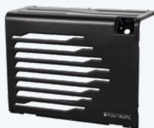
DE SERIE : DARK ABS 70% recyclé noir mat

Équipée de série avec la façade DARK ABS, la façade choisie en option est livrée montée :