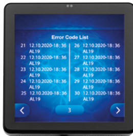
Historique des 50 derniers événements