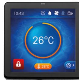
NEW ! Ecran TFT verrouillable pour éviter les mauvaises manipulations