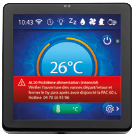
Affichage de l'alarme, diagnostic et solution de résolution